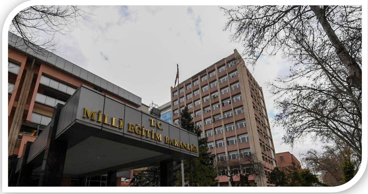
Bakanlık Merkez Bina