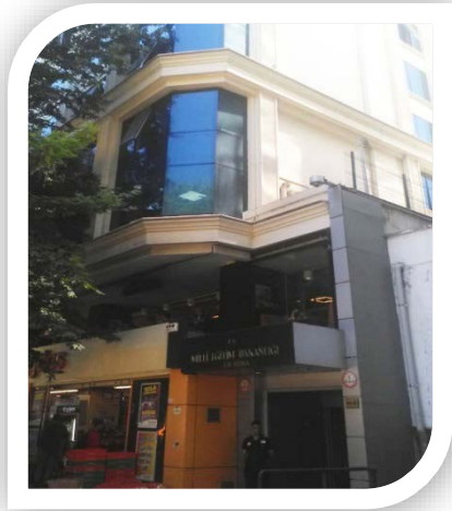
Millî Müdafaa Caddesi -Ek Bina