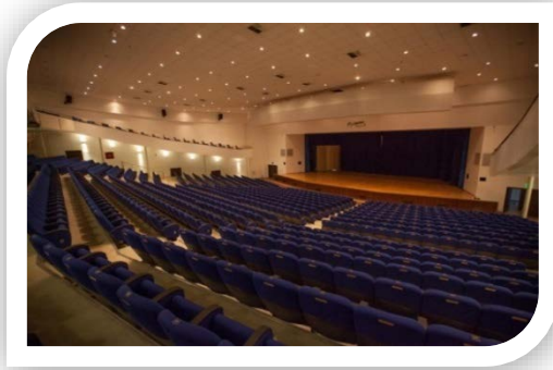
MEB Şura Salonu